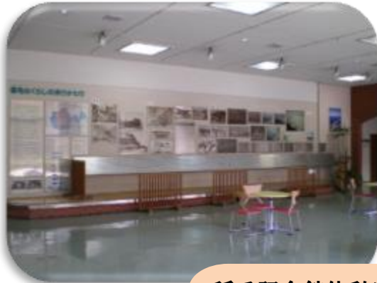
稲毛記念館休憩室